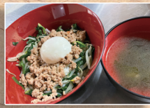
ビリ辛肉味噌丼 中華スープ