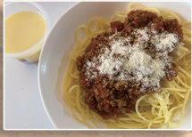
スパゲッティミートソース プリン