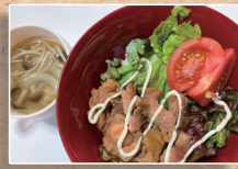
鶏マヨチキン丼 きのこスープ