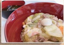
中華丼 中華スープ

『ベークリー』では、新しく「カレーパン」の試作を行っています。具材から手作りしており、トマト風味の「カレーパン」に仕上がっています(橋本)