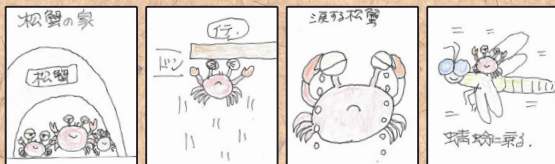
松蟹の家。 ドン「イテッ」 涙する松蟹。 蜻蛉に乗る。