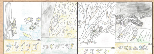
「ナキイナゴ・ノコギリクワガタ」 「クマゼミ・ヤママユ蛾」