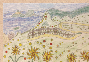
「新潟の佐渡島」 Y・Sさん